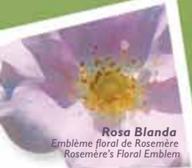
Rosa Blanda Emblème floral de Rosemère Rosemère's Floral Emblem

Une ville en harmonie! A town in harmony!