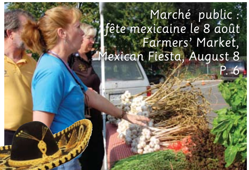
Marché public : fête mexicaine le 8 août Farmers' Market, Mexican Fiesta, August 8 P. 6