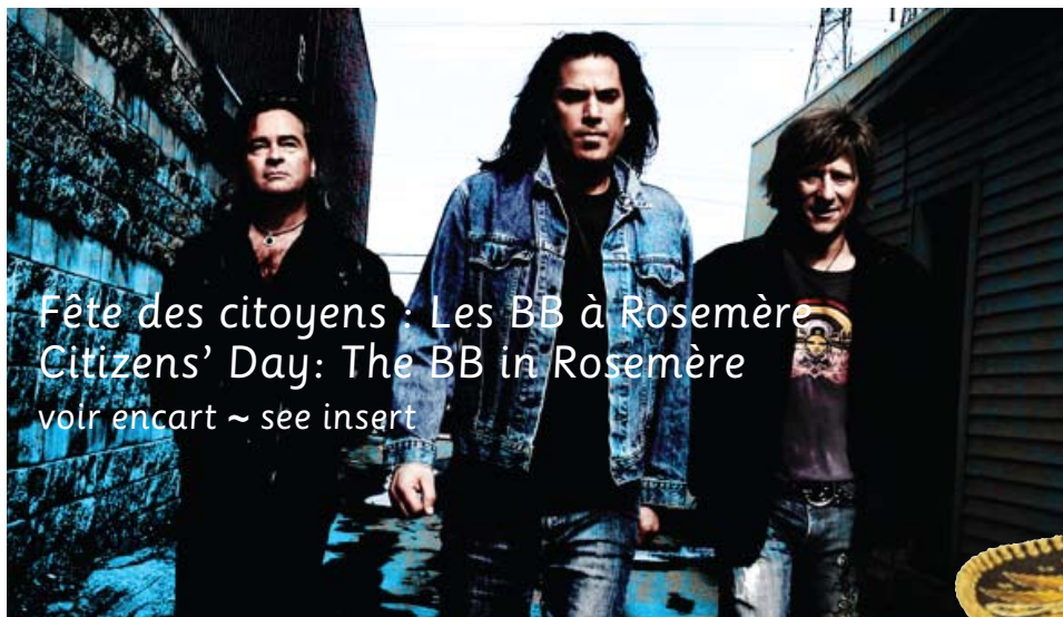
Fête des citoyens : Les BB à Rosemère Citizens' Day: The BB in Rosemère voir encart ~ see insert