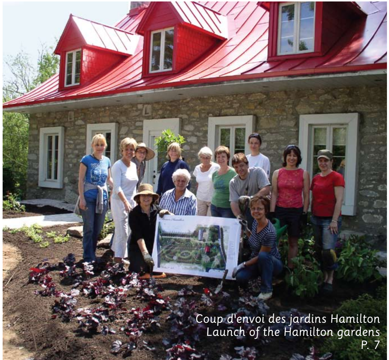
Coup d'envoi des jardins Hamilton Launch of the Hamilton gardens P. 7

LOISIRS ET CULTURE ~ RECREATION & CULTURE P. 15-16